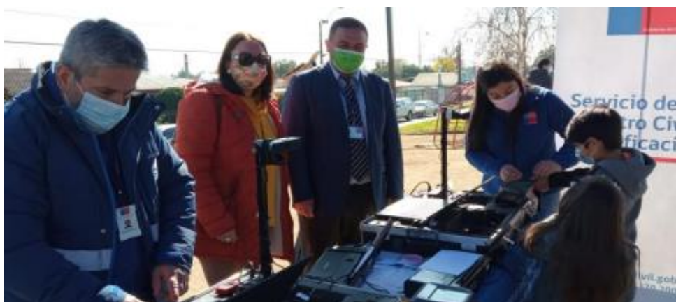
Plaza de Justicia Región del Maule