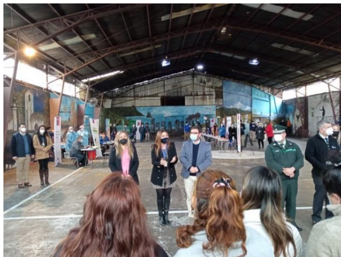
Plaza de Justicia Región del Ñuble.