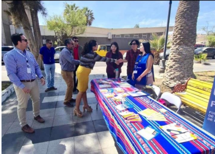
Plaza de Justicia Región de Arica y Parinacota