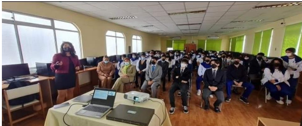
Diálogo región de Arica y Parinacota

En el siguiente recuadro se detallan los diálogos efectuados durante la gestión 2022.