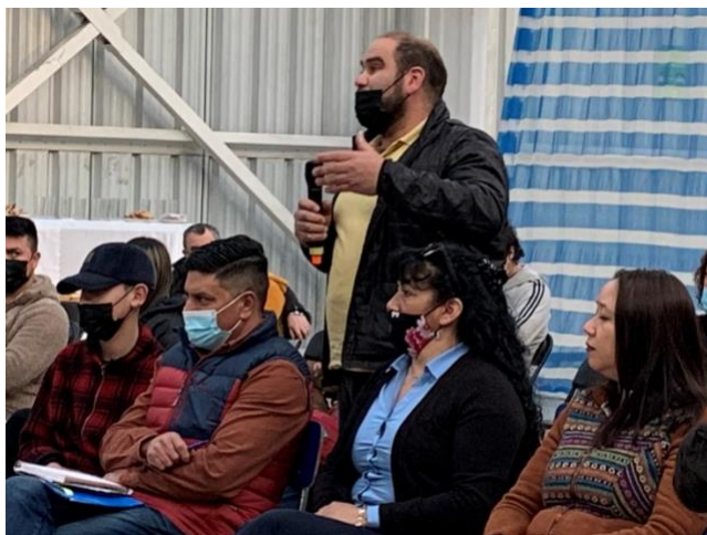
Diálogo Región de Aysén.